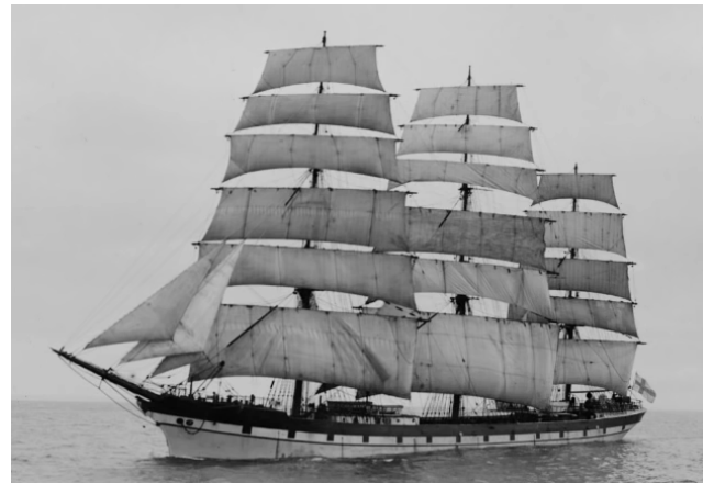
Kanske var det så här fullriggaren Taifun såg ut.