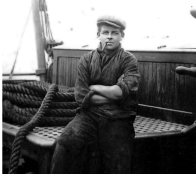
Evert Taube under sin tid som sjöman.