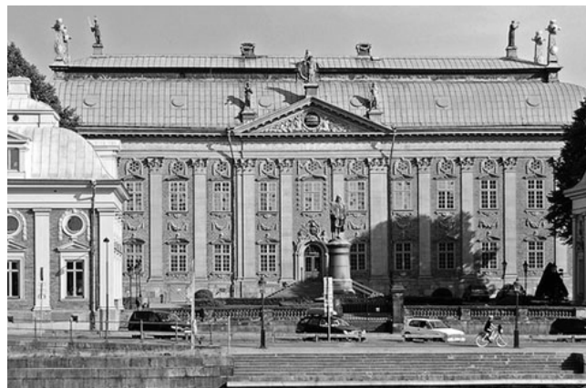
Riddarhuset i Stockholm.

Detaljerade uppgifter kring program, boende med mera kommer i samband med årsmötet i höst. Men skriv redan nu in datumen i kalendern: 1-3 september 2017.