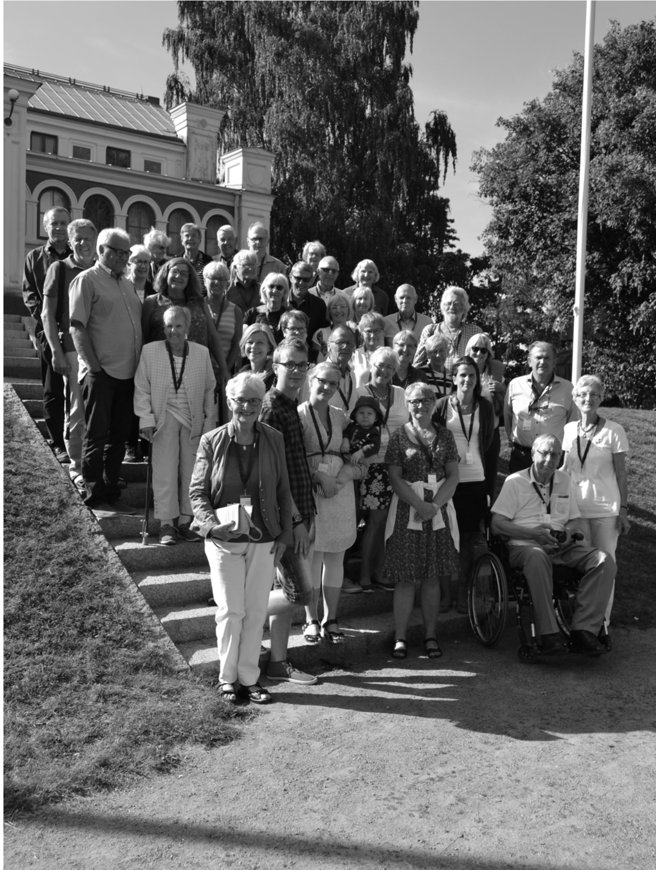
Ett 60-tal släktingar mötte upp i ett strålende soligt Växjö den 22 augusti 2015.