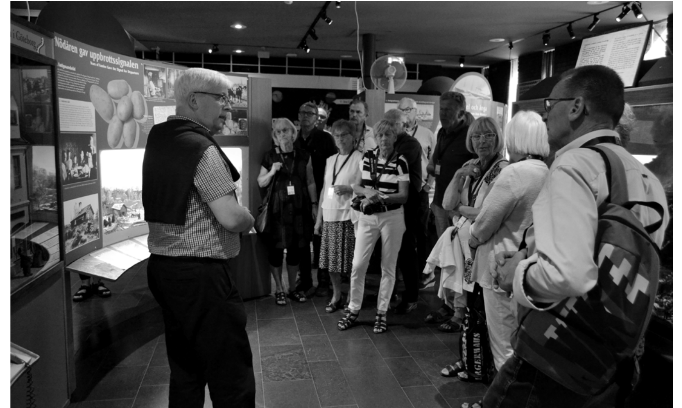
Vi fick en guidad tur bland utställningarna på Utvandrarnas bus under mellanmötet i Växjö. Hur var det för dem som utvandrade från Sverige företrädesvis till Nordamerika? Tänkvärt och högaktuellt i dessa tider.