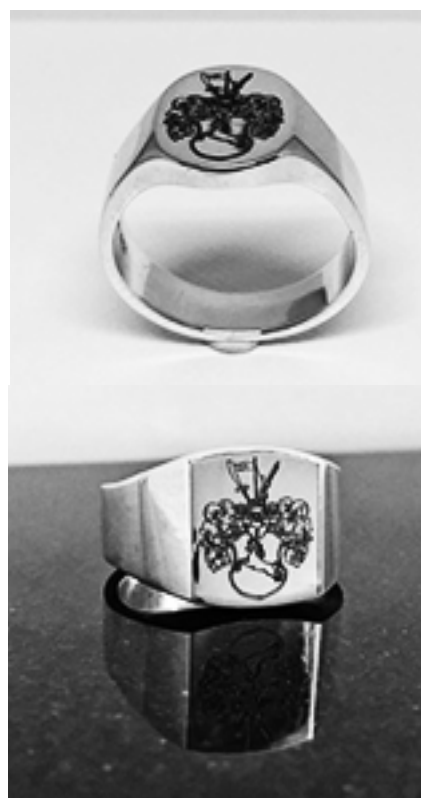
Klackring modell 1